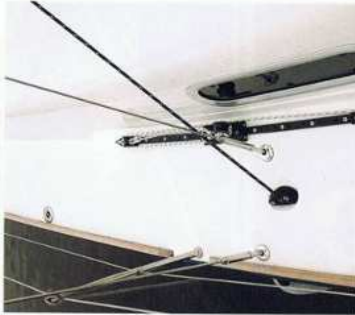
De greetschoot loopt onder het gasboord naar de lier.