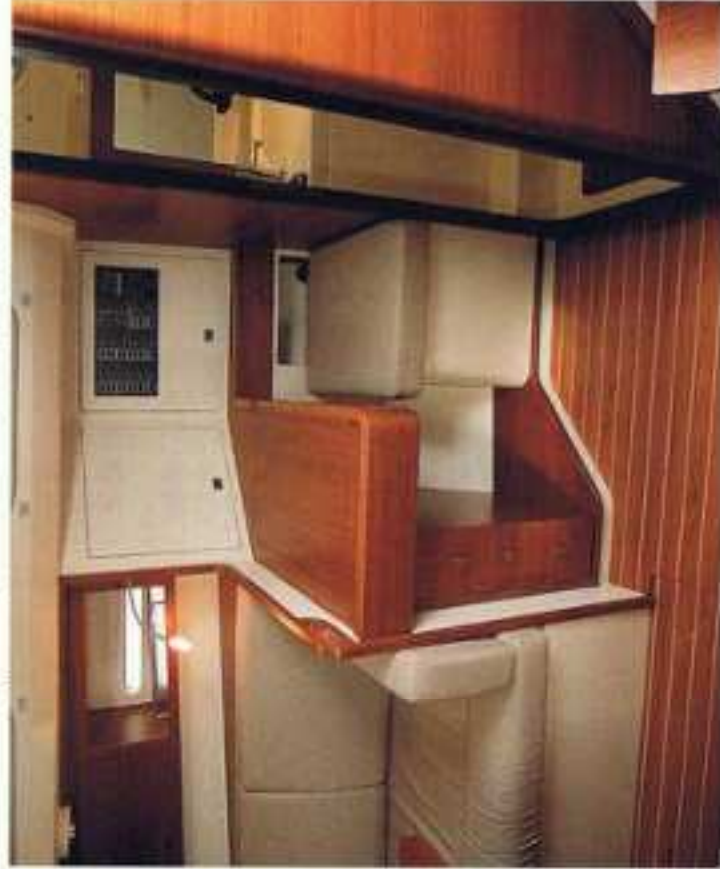
De navigatieboek biedt veel plaats voor apparatuur en kaartmateriaal. De zitplaats is helaas erg smal.

boordbank, evenals de acculader, maar is niet gezekeerd. De elektronica staat vrijwel tegen de scheepshuid, waar door vocht of water op het vlak er gemakkelijk bij kan komen. De watertank is onder de bakboordbank geplaatst, de brandstof tank is ingebouwd onder de kuip.