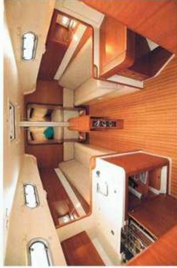
We zijn aangenaam verrast door de ruime benedendeks.

We moeten onszelf er steeds aan herinneren dat we in de 36-voeter staan. De vorm van het dak en de strategische plaatsing van ruiten bieden een lichte en ruime saloon.