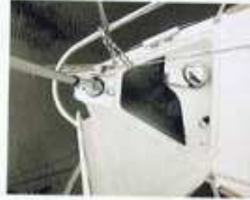
Diepe achterdek met uitstekende afwatering.