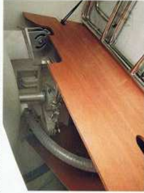
De rserconstructie is voorzien van Jefa-lagers. Dankzij korte kabels reageert het roer zeer direct op het stuurwiel.