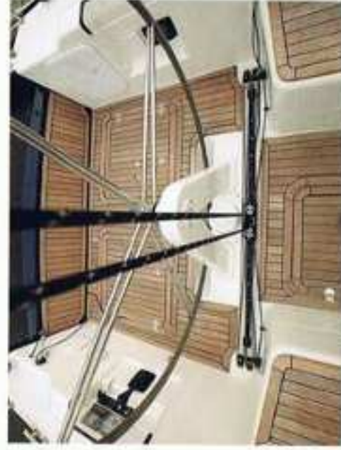
Vanuit de stuurpositie kan de overloop gemakkelijk worden bediend.

De standaardluxeprijs zijn berekend: Simrad navigatiepakket, antifoeling, irspacer verwarming, middenkokers en buiskap.