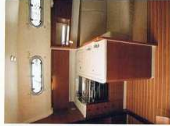
De kriebuis is klein, maar compleet.