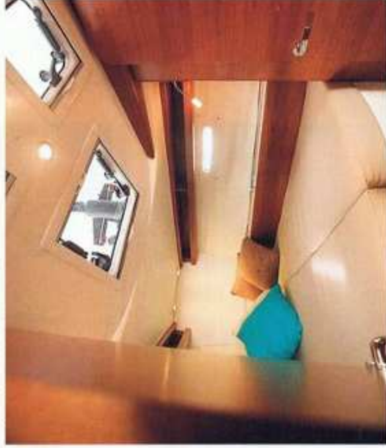
Flush lúken en patrijspoorten verlichten de voorpiek.