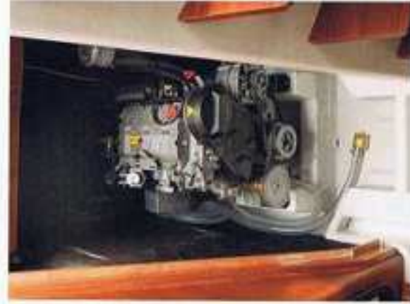
Vitale onderdelen zijn prima te inspecteren.